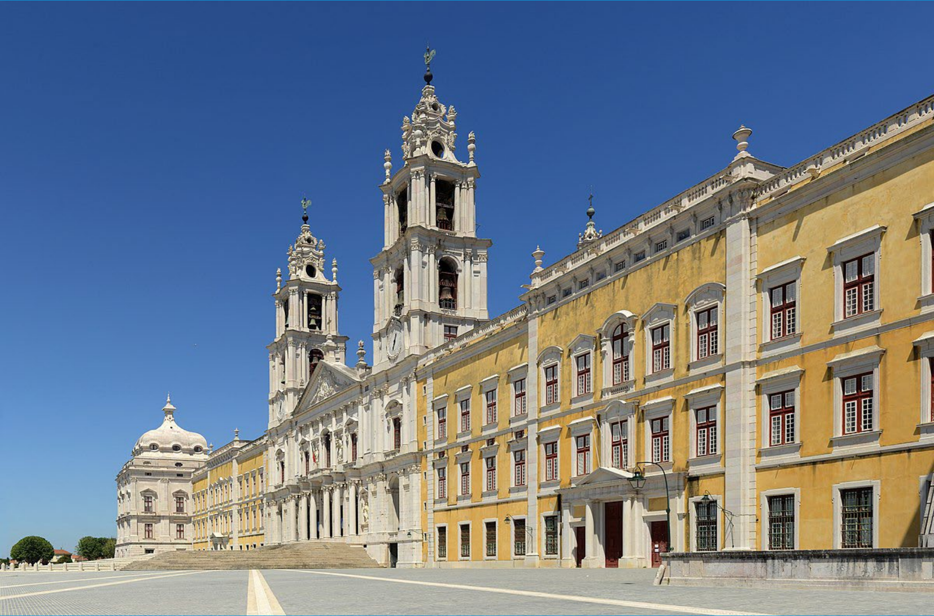
Palacio de Mafra