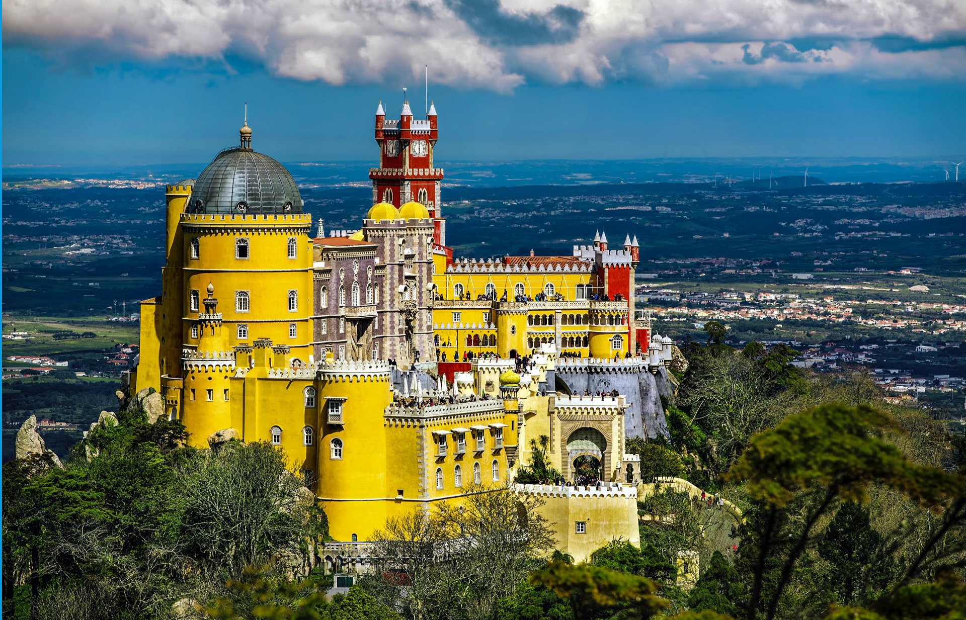
Palacio Nacional da Pena a Sintra