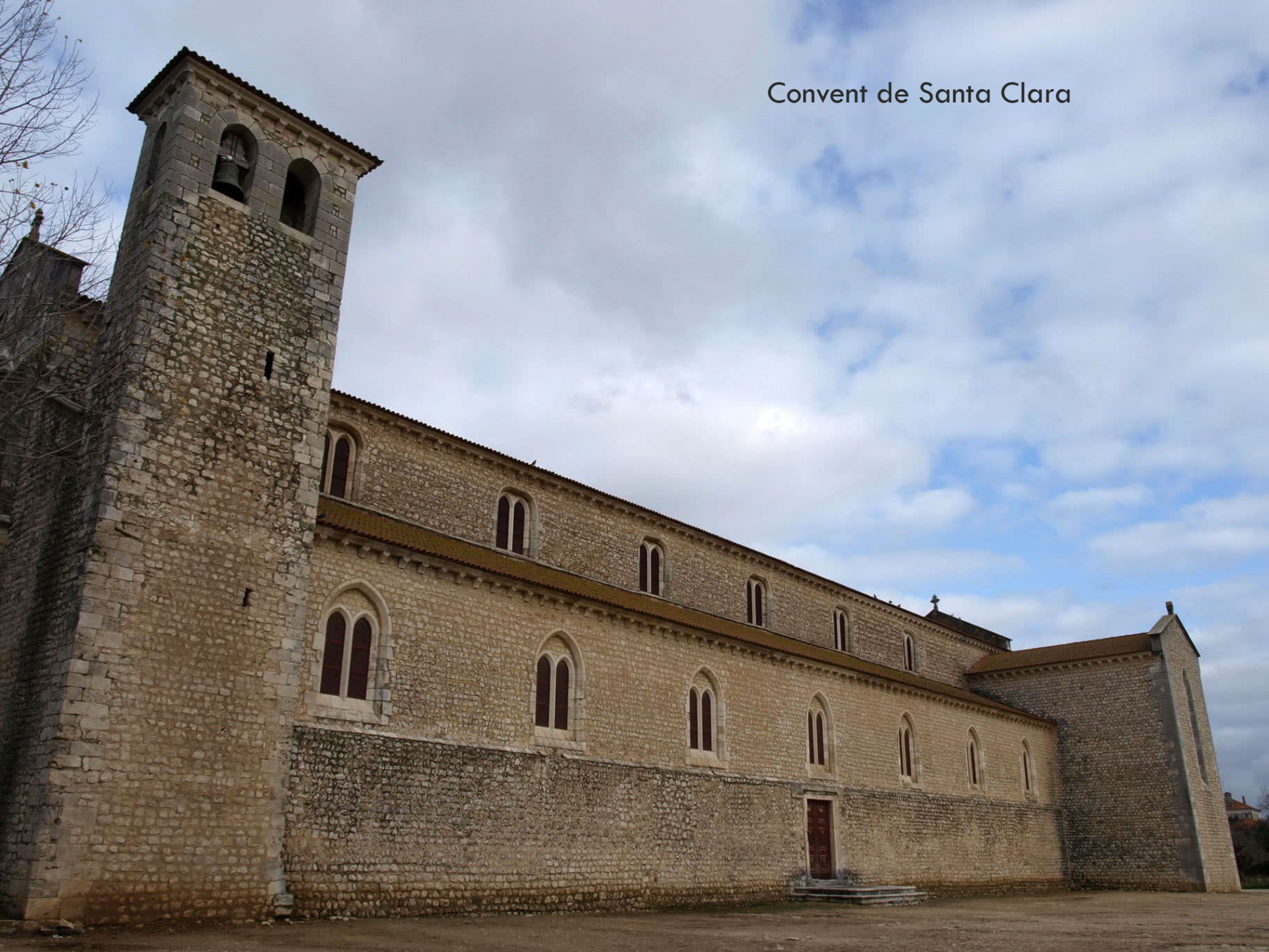
Convent de Santa Clara