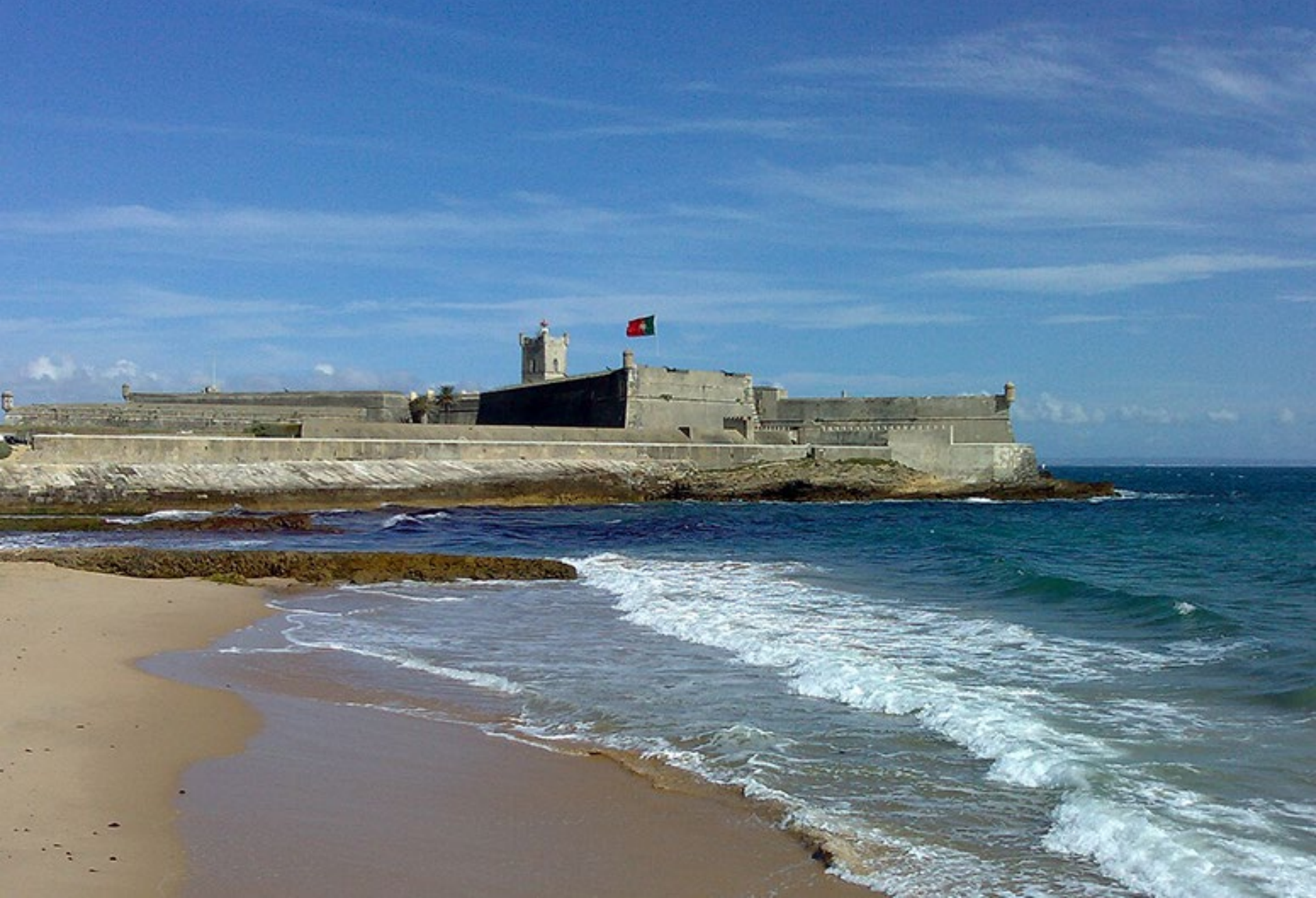
Forte de São Julião da Barra