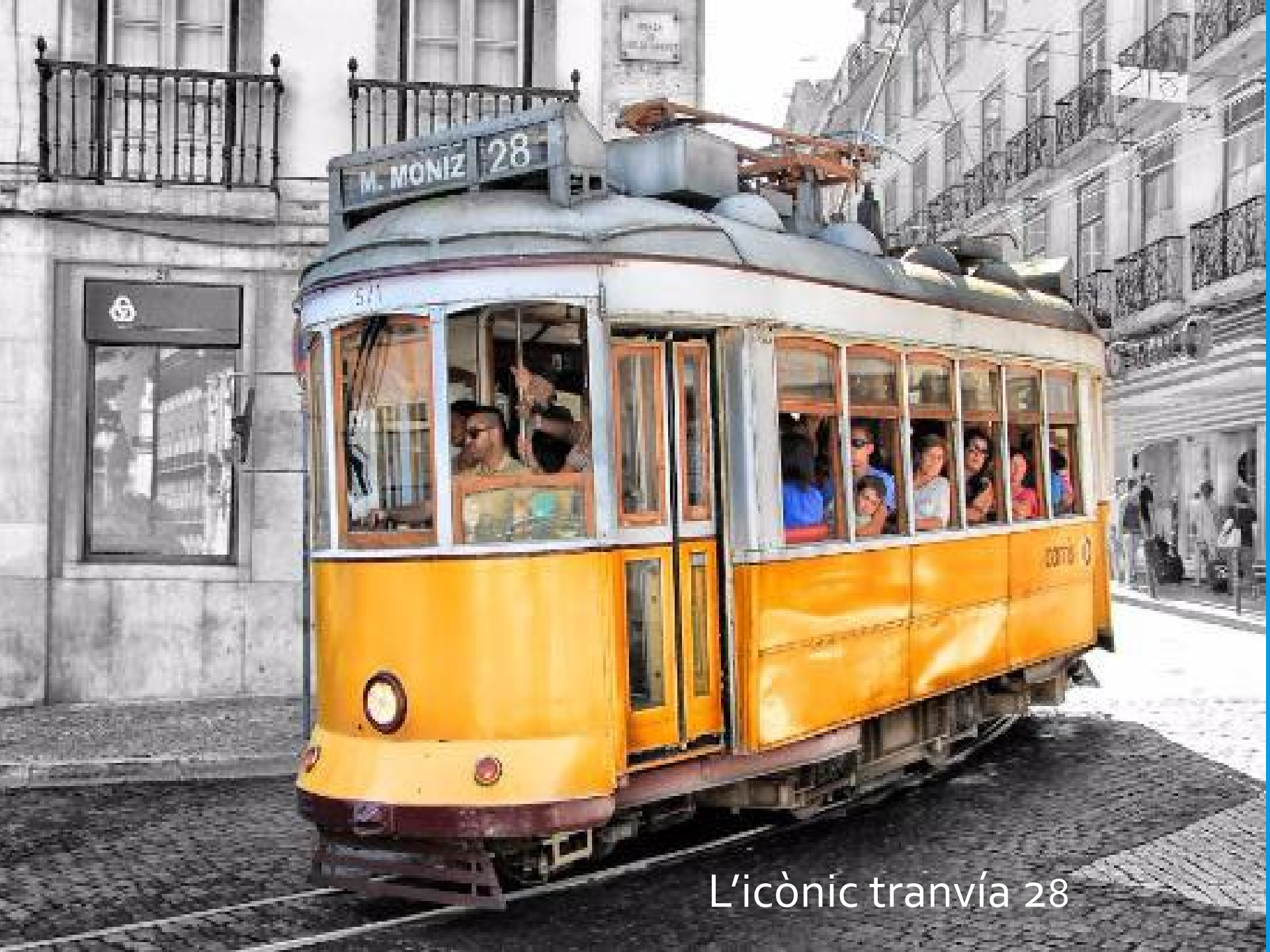
L'icònic tranvía 28