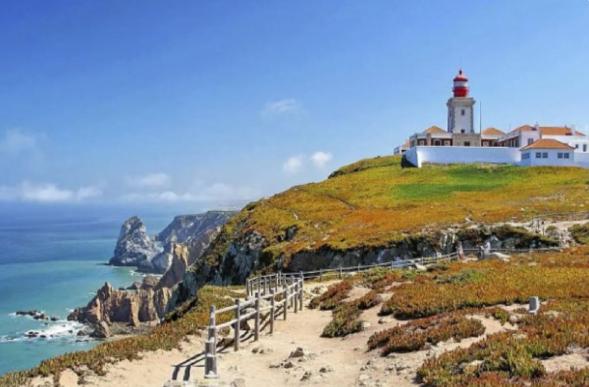
Cabo da Roca