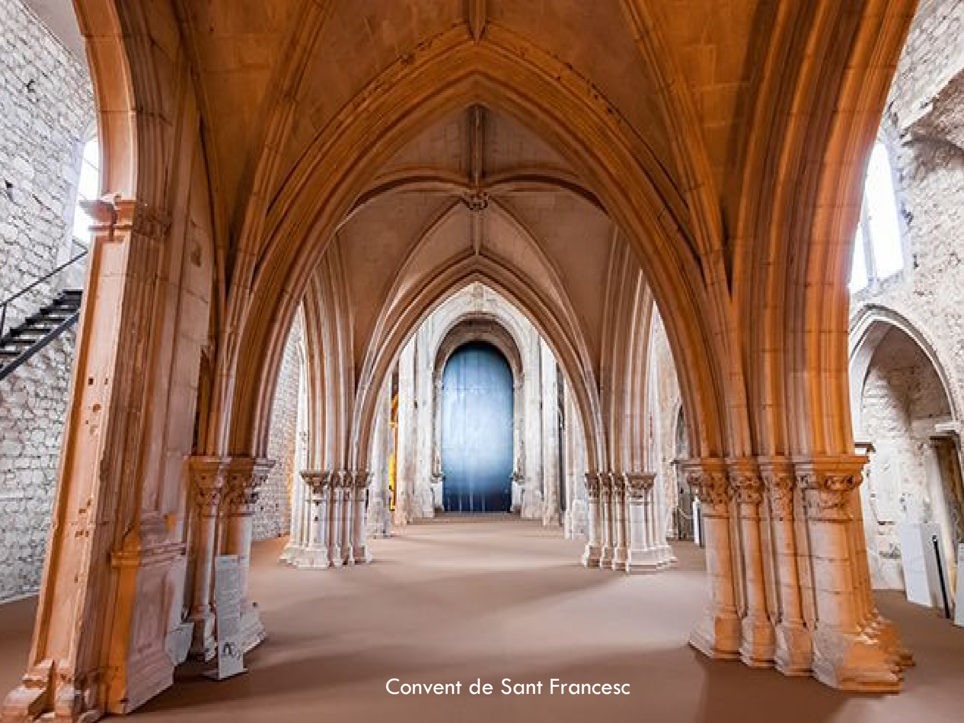
Convent de Sant Francesc