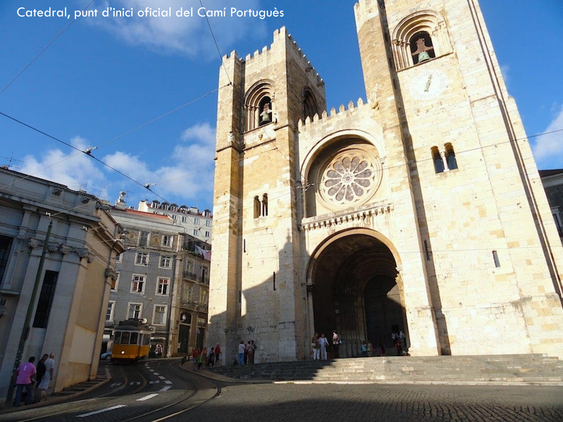
Catedral, punt d'inici oficial del Camí Portuguès